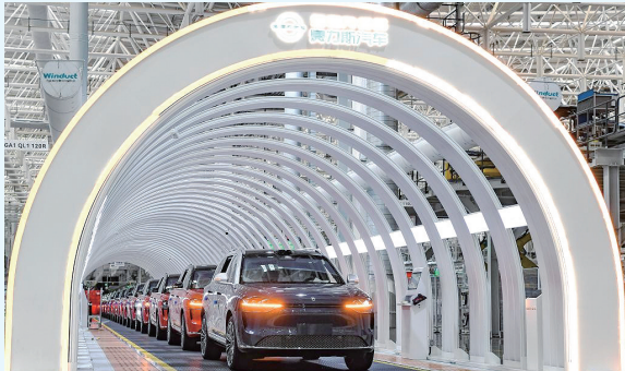
这是在位于重庆市两江新区的赛力斯汽车超级工厂拍摄的即将下线的新能源汽车。