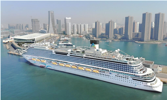
“爱达·魔都号”邮轮靠泊在青岛邮轮母港码头(无人机照片)。