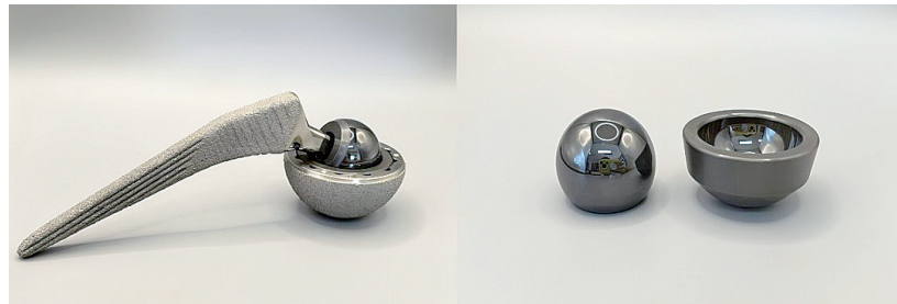
中材生物参与研发的陶瓷关节

在安徽省市场监督管理局、安徽省工业和信息化厅近日发布的“2025年安徽省数字化质量管理创新与实践十大典型案例”中,瑞泰马钢新材料科技有限公司(简称“瑞泰马钢”)申报的《借力“透明”智造,质领中国耐火》成功入选,成为马鞍山唯一上榜案例。