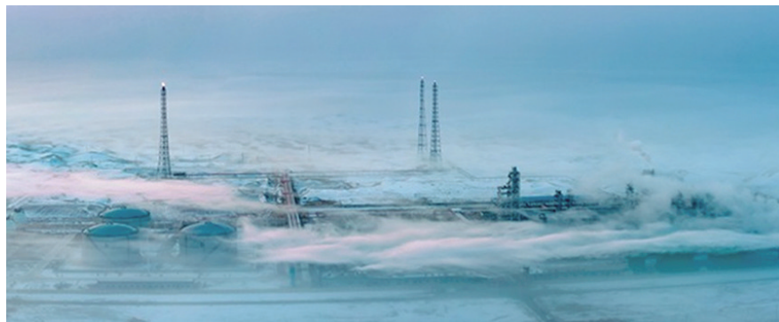
中国石油化工集团有限公司在塔里木盆地打造的“深地一号”顺北油气田基地。