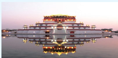
无锡灵山五印坛城