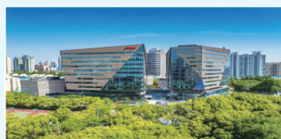
上海海粟文化广场