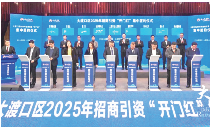
大渡口区2025年招商引资“开门红”集中签约仪式

综合能源站建设运营总部项目,拟投资25亿元在大渡口区打造地区运营研发总部,计划在成渝地区共建设100座综合能源场站,每个场站将提供光