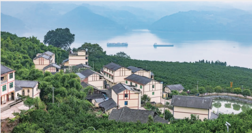
重庆市忠县友谊村万亩橘园