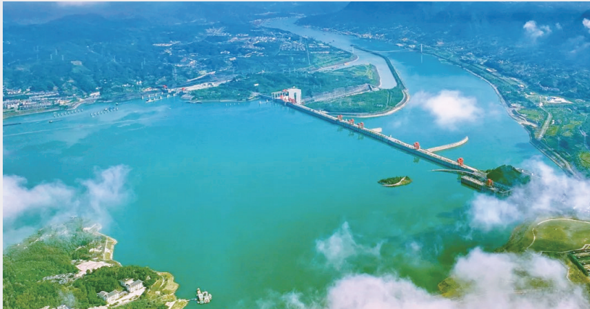
高峡出平湖