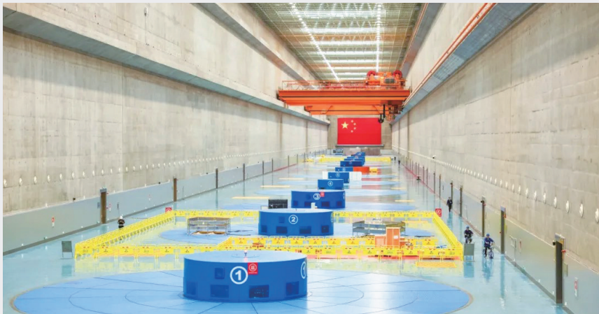
三峡左岸电站内部整齐排列的发电机组