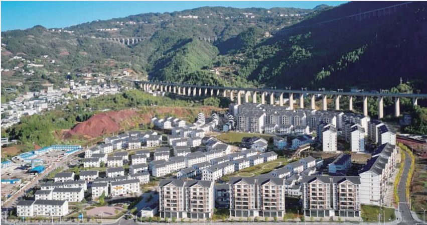
巴东高铁站东侧新建的移民新居