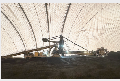
宣化热电煤场实景