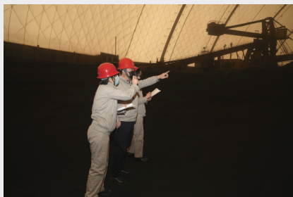
宣化热电燃煤掺烧工作人员在煤场实地调研