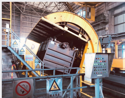
宣化热电煤场翻车机工作现场