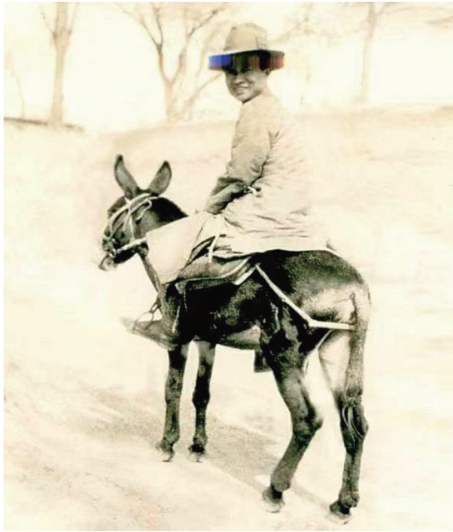
1929年夏秋之交,晏阳初骑着小毛驴来到定县(现河北定州市)东亭镇翟城村