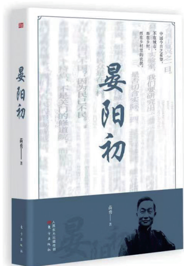
苗勇创作的长篇传记文学《晏阳初》,2022年1月入选东方出版社2021年度十大人文社科好书榜,2022年12月获首届李劫人文学奖入围奖