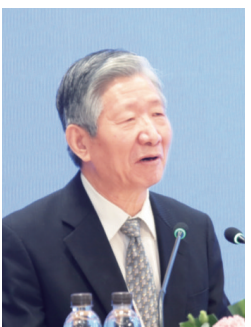
中国企业评价协会会长、国务院发展研究中心原副主任侯云春