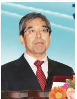
全国政协常委、经济委员会副主任,国务院发展研究中心原党组书记马建堂