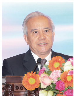
十二届全国政协主席、全国工商联原主席王钦敏