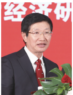
全国工商联原副主席、中国民营经济研究会会长李兆前