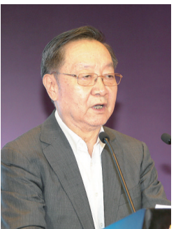
中国工业经济联合会会长、工业和信息化部原部长李毅中