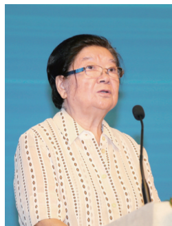
十届全国人大常委会副委员长顾秀莲