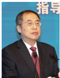
中国企业联合会、中国企业家协会党委书记、常务副会长兼秘书长朱宏任