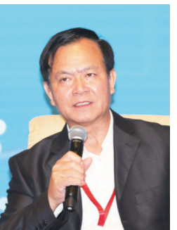
十二届全国政协常委、国务院参事李玉光