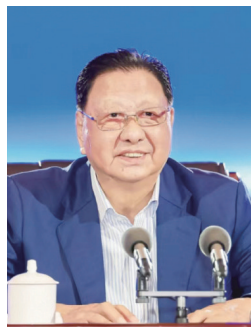
十届全国政协副主席,中国企业联合会、中国企业家协会会长王忠禹