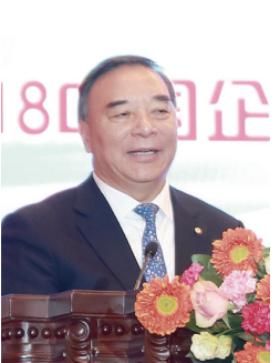
中国上市公司协会会长、中国建材集团原董事长宋志平