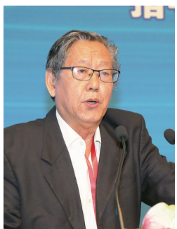
中国企联原执行副会长、《经济日报》原总编辑冯并