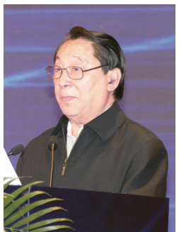
十二届全国政协副主席齐续春