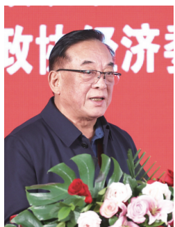
全国政协参政议政人才库特聘专家、十二届全国政协经济委员会副主任石军