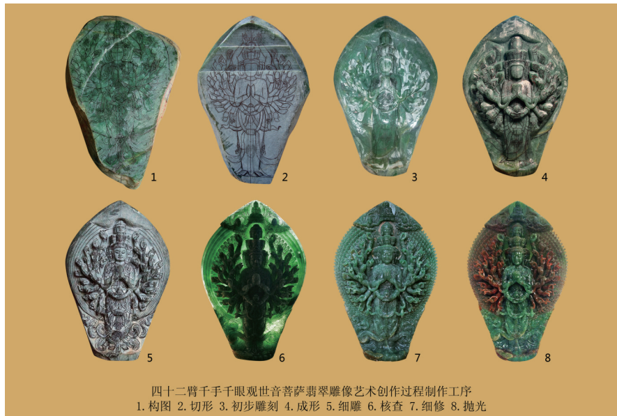
四十二臂千手千眼观世音菩萨翡翠雕像艺术创作过程制作工序 1.构图 2.切形 3.初步雕刻 4.成形 5.细雕 6.核查 7.细修 8.抛光