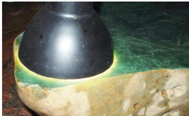
灯光下“翡翠皇帝”原石

自20世纪80年代起,我国云南边境与缅甸接壤之处的象城盈江已成为全国最大的翡翠原料集散地和交易场所,无数寻宝志士与爱玉之人怀着对翡翠的浓烈情感,在这里掀起一次次“翡翠赌石”热潮。而在热闹非凡的“翡翠赌石”背后,不知演绎出了多少惊心动魄、鲜为人知的淘宝故事。