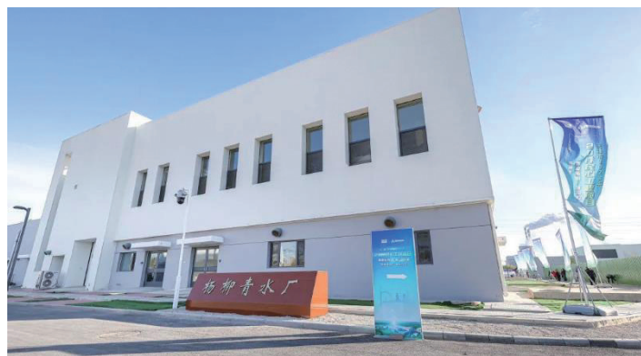
天津市民心工程杨柳青水厂

守住安全生产“线”,严把工程质量关。为了严管质量安全、保持政治清醒,着力打造优质工程、放心工程、廉洁工程,天津水务坚决遏制重特大安全生产事故在工程项目上发生,努力建设经得起历史和人民检验的高品质工程。绷紧廉政安全“弦”,坚持严的基调、严的措施、严的氛围,坚持以案为鉴、