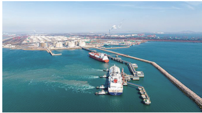
2月23日,中国石化天然气分公司青岛LNG接收站“双船双泊位”同时作业。

驰援一线,第一时间助力抗灾救援。2月初,湖北地区普降大雪,中国石化湖北石油成立100余支党政工团朝阳服务队,为滞留人员免费提供5万余份速食,赢得司机乘客广泛称赞。中国石化安徽石油面对低温雨雪