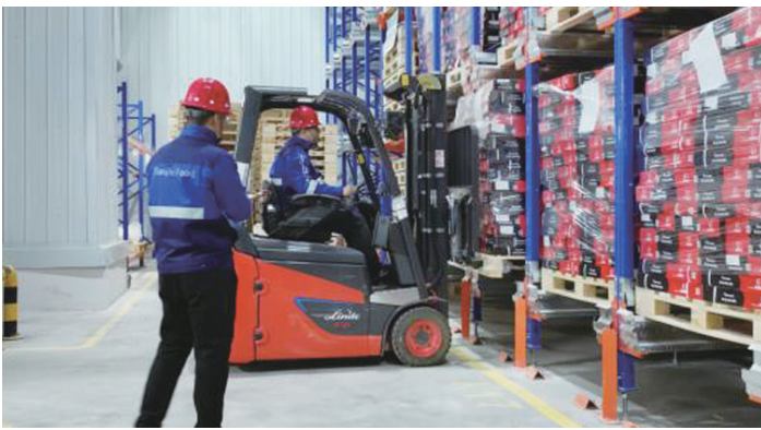
食品集团供应链公司仓储物流部员工对入库商品进行核对

既有培育新质生产力的优质项目，又有拓展未来产业新赛道的潜力项目。天津食品集团重点推动延链补链项目建设，持续拉动产业集群发展，加强与乳品头部企业合作。存栏 12 万头的现代化楼房生猪养殖基地已竣工投产。此外，供应链冷链物流基地项目进展顺利，一期项目完成竣工验收并投入使用，二期项目顺利封