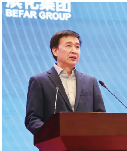
滨州市委副书记、市长李春田讲话