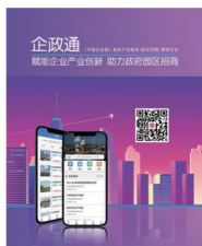
合作园区可扫码进入数据库查询符合项目

为更好服务地方园区的招商引资业务，集团建立企政通APP，积累战略新兴产业项目的项目库。对于合作的地方政府和园区，可根据产业发展方向给园区提供产业项目信息。