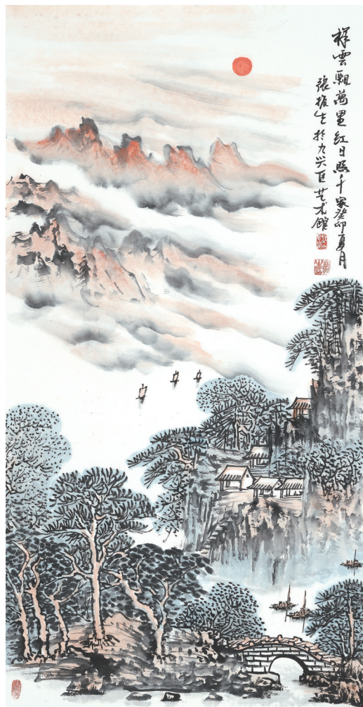
《祥云飘万里 红日照千家》