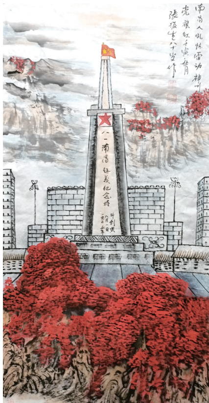
《南昌人吼惊雷动 神州党旗红》