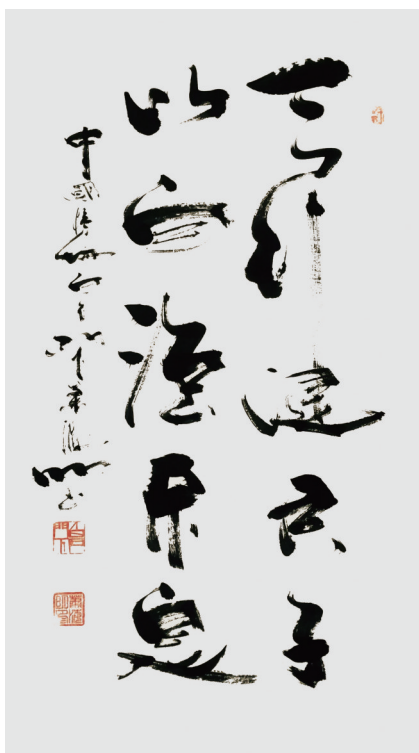
《天行健 君子以自强不息》