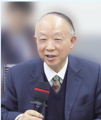
中国海事仲裁委副主任, 中国物流与采购联合会原常务副会长丁俊发研究员