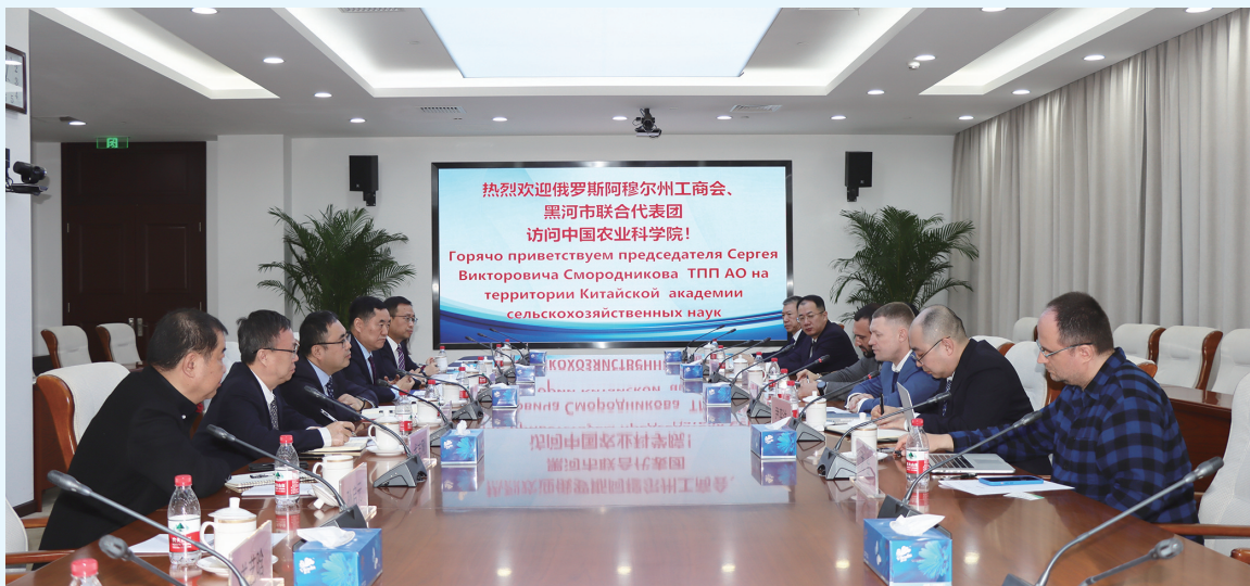
俄罗斯阿穆尔州工商会、黑河市联合代表团到访中国农业科学院

可以预见,俄阿穆尔州工商会参访团的新春之旅将拉开新时期中俄经贸合作的序幕,为加深中俄两国的经济往来建起新的桥梁。