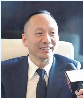
中国服务贸易协会副会长兼秘书长仲泽宇