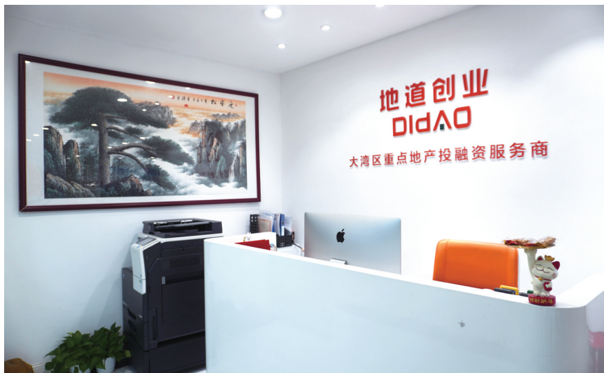
地道家人之创业,专注城市更新界(地道前台照片)