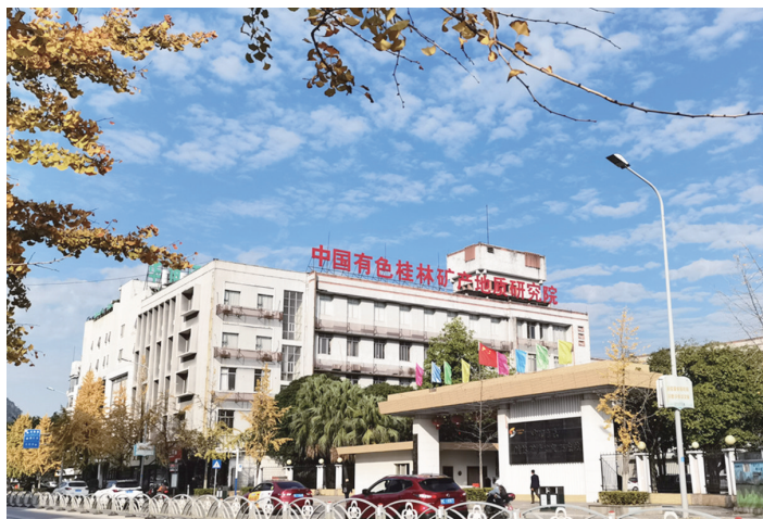
中国有色桂林矿产地质研究院

中国有色桂林矿产地质研究院有限公司(以下简称“中色桂林院”)积极响应国家伟大号召,奉行“人才为先、创新为本、合作共赢、和谐发展”企业核心价值观,秉持“服务集团资源增储、助力集团‘资源报国’、致力公司创新发展、惠及员工、回报社会”的企业使命,坚守“严谨求实、勇于创新、追求卓越”企业精神,倡导“创新诚信务实高效”的经营管理理念,致力于成为矿产资源、新材料及环境服务领域具有全球竞争力的一流高科技企业。牢固树立和践行“绿水青山就是金山银山”的生态文明理念,落实国家领导人视察广西重要讲话精神,充分发挥央企核心引擎优势,策划实施一批具有重要示范作用的生态修复工程,围绕桂林市漓江流域废弃采石场生态修复技术攻关和工程示范,集聚自然资源部南方石山地区矿山地质环境修复工程技术创新中心合作单位优势,铸造矿业生态修复主力军,凝练技术方向,联合攻关创新,推动生态修复技术成果的转化应用,打造环境治理、片区开发和产业导入一体化的新时代生态修复模式,为扎实推动绿色发展,生态环保高质量发展,促进人与自然和谐共生,共同建设美丽中国做出了富有成效的探索尝试。