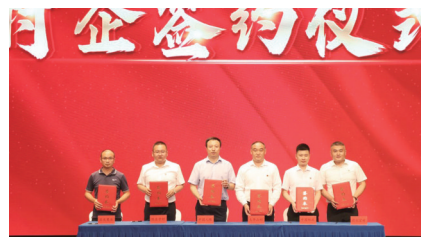
“合作共赢 村企结对”签约仪式