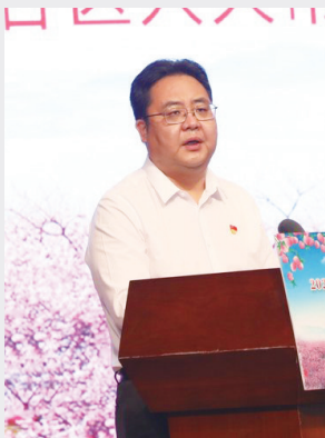
平谷区人大常委会主任刘震讲话