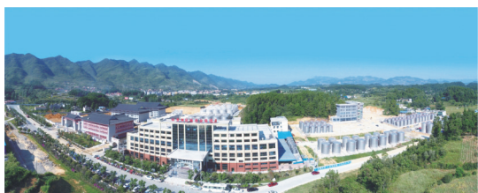
贴牌生产 / 企业定制 / 原酒供应 / 品牌酒销售

经数十年的发展,民族酒业集团已发展成拥有7大子公司、5大酿造厂区、年产优质酱香酒1万余吨的集团公司。