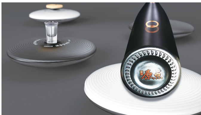
独创藏名设计、品名深藏于底

以极简的设计风格,取意中国东方智慧的“藏”文化;以人生境界的处世之道为基准,辐射到酒品风味与包装设计。