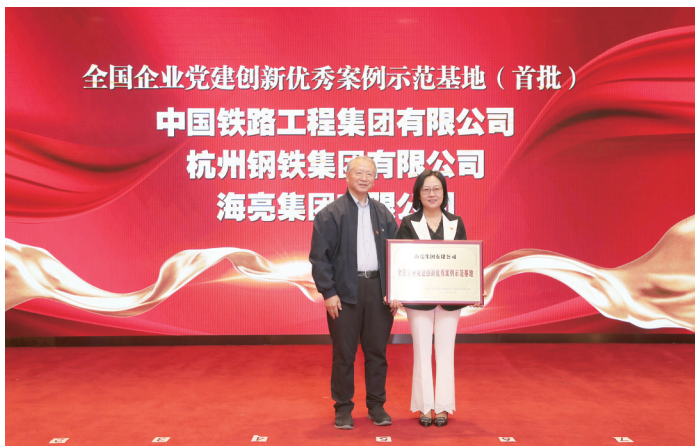
海亮集团获授全国企业党建创新优秀案例示范基地(全国民营企业唯一一家)

聚才兴业、德惠万家,坚持以党的先进性引领企业文化的先进性,用信义品格、清正文化、奋斗精神等海亮品质诠释社会主义核心价值观。海亮集团将“以人为本、诚信共赢”的文化理念渗透到企业的体制创新、经营管理、产品开发、市场拓展、品牌提升、形象塑造等方面,成功将