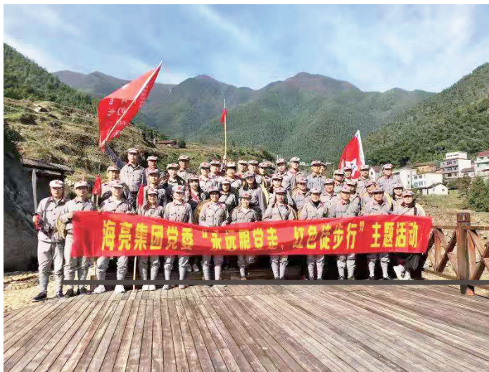
海亮集团党委红色徒步活动