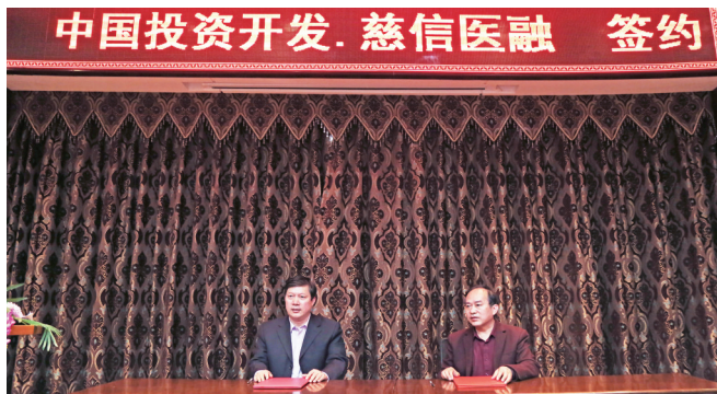
中国投资开发·慈信集团投资签约仪式现场