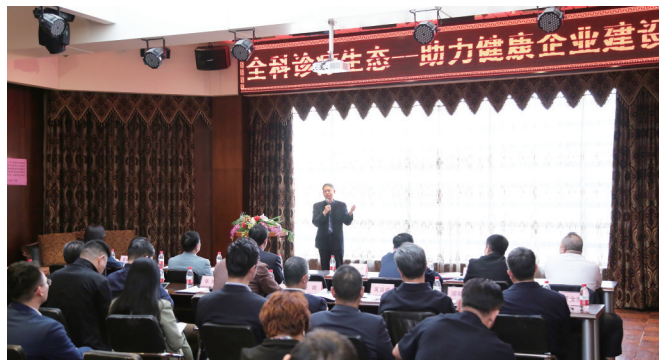
助力全科诊疗生态建设研讨会