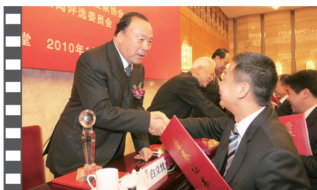
2010年1月,2009年度中国企业十大新闻发布活动在北京人民大会堂举办,第九届、第十届、第十一届全国政协副主席白立忱为获奖单位颁奖。

《中国企业报》,中国企业网,中国企业APP,《中国企业报》微信、微博,战新产业微信、特色小镇微信,构建起集内容传播、品牌推广于一体的全媒体服务矩阵。