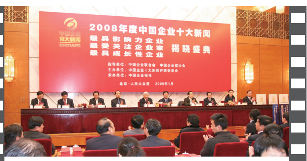
2009年1月,2008年度中国企业十大新闻发布活动在北京人民大会堂隆重举办。