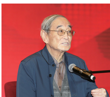
十届、十一届、十二届全国政协常委, 经济委员会副主任,著名经济学家厉以宁