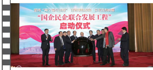
2018年12月28日,北京人民大会堂,在第十六届中国企业发展论坛上,举办了国企民企联合发展工程启动仪式。