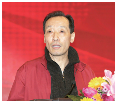
全国政协委员、中华全国新闻工 作者协会原党组书记崔惠生