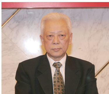
十一届全国人大常委会副 委员长周铁农