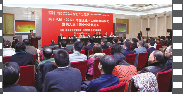
2013年1月,第九届中国企业发展论坛在北京人民大会堂举办。