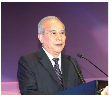
十二届全国政协副主席王钦敏