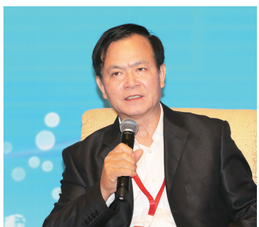
十二届全国政协常委、国 务院参事李玉光