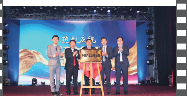
2019年12月21日,北京饭店,在第十七届中国企业发展论坛上,中日产业合作联盟正式揭牌。