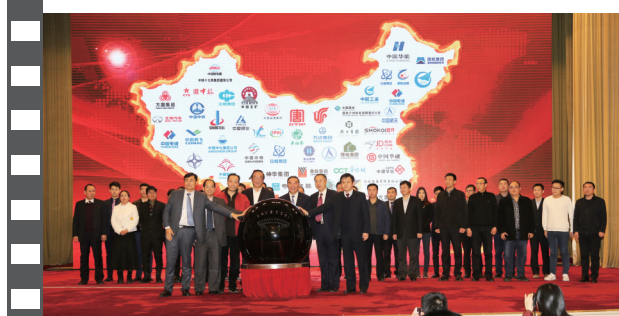
2018年1月20日,北京人民大会堂,在第十五届中国企业发展论坛上,30家企业代表共同启动“十九大精神进企业系列活动”。