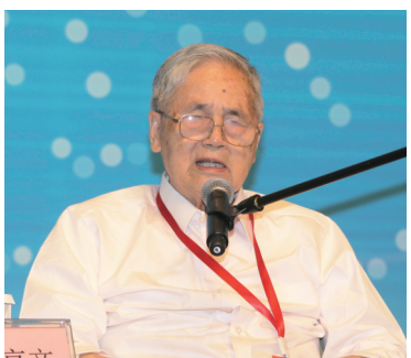
中国工程院院士、著名经济 学家李京文