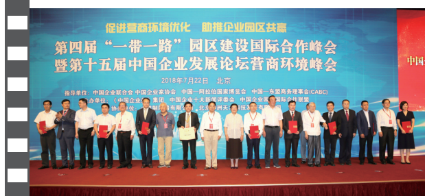
2018年7月22日,北京钓鱼台国宾馆,在第十五届中国企业发展论坛上,参会嘉宾与十佳案例获评单位代表合影。