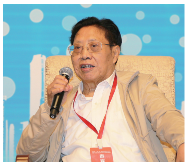
外交部原副部长、外交部政策 咨询委员吉佩定