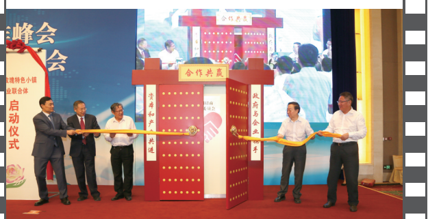
2017年6月25日,北京钓鱼台国宾馆,在第十四届中国企业发展论坛上,由《中国企业报》集团等联合发起的“全国招商联合委员会”宣告成立并举行了揭牌启动仪式。