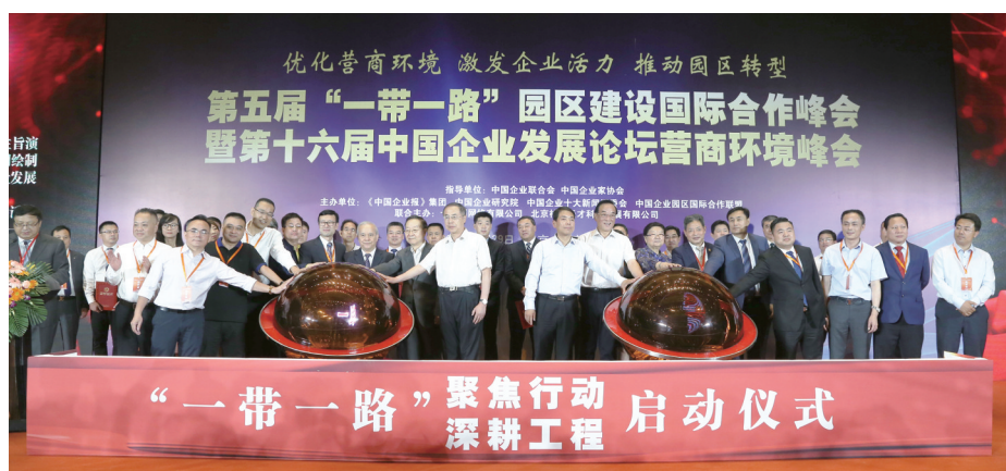
2019年6月29日,北京国家会议中心,在第十六届中国企业发展论坛上,《中国企业报》集团联合相关企业、机构发起了“一带一路”行动工程——合作公司启动仪式和重点项目启动仪式。

2017年9月8日,中共中央、国务院发布《关于营造企业家健康成长环境 弘扬优秀企业家精神 更好发挥企业家作用的意见》,为营造企业家健康成长环境、弘扬优秀企业家精神、更好发挥企业家在经济发展中的作用指明了方向。