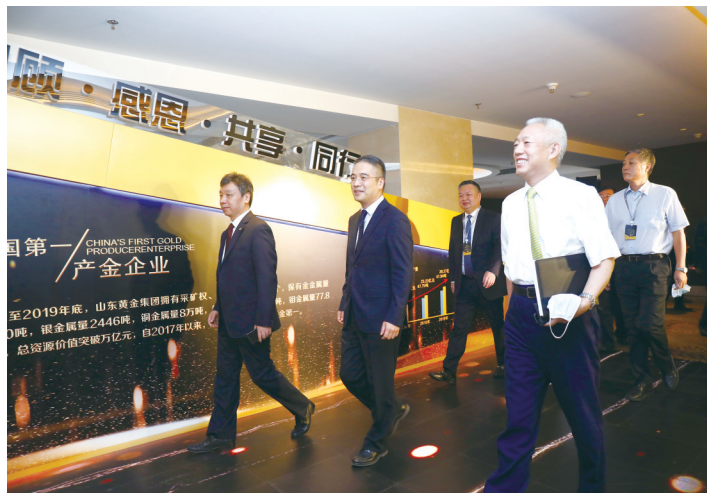
2020年9月，山东黄金在北京召开“回顾 感恩 共享 同行”战略发展交流会，与政府、行业、合作伙伴共同回顾“十三五”，展望“十四五”。

一方”的社会责任理念落到实处，以实际行动回馈驻地社区，不断为驻地和周边社区经济发展、人员就业谋福祉。目前，山东黄金已投入各种救助、公益类资金逾20亿元，主动认捐1亿元慈善专项基金，基金增值比例7%，每年捐赠善款700万元用于企业内部及社会慈善救助。特别是在抗击新冠肺炎疫情期间，山东黄金在做好自身疫情防控工作的同时，