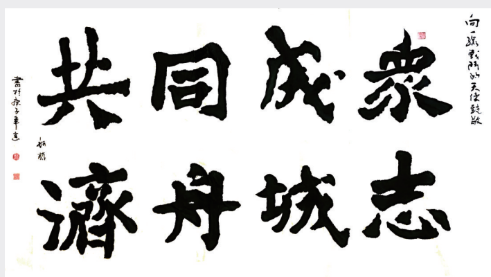
《众志成城,同舟共济》