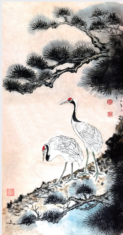
《苍松自古思高健,寿鹤于今添仙杰》