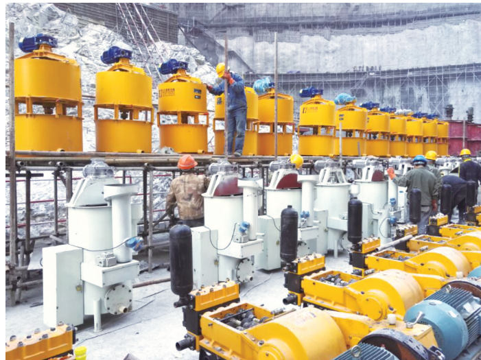
“水泥灌浆智能控制关键技术和成套设备”在金沙江乌东德、白鹤滩水电站实现规模化应用,其中在乌东德水电站应用灌浆43.9万m 3 ,在白鹤滩水电站应用灌浆35万m 3 。

该成果的应用,有效减少了灌浆施工中的人为干预,保证了灌浆数据真实、准确,现场灌浆异常问题实现实时响应,有力保