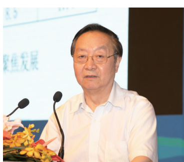
十二届全国政协常委、经济委员会副主任、国家工业和信息化部原部长李毅中

为了落实中共中央、国务院《关于营造企业家健康成长环境 弘扬优秀企业家精神 更好发挥企业家作用的意见》（中发〔2017〕25号）和国务院办公厅下发的《关于聚焦企业关切进一步推动优化营商环境政策落实的通知》，从2018年5月开始，《中国企业报》集团持续两年时间，分赴全国100个地市、近1000个县区和园区，深入一线采访调研和产业服务，并于2018年发布了两批“中国企业营商环境（案例）十佳城市”榜单。2019年，《中国企业报》集团再次组织调研小组分头深入地方一线，进行营商环境实地调研，最终形成“2019中国企业营商环境（案例）十佳城市（第三批）”等多个榜单，并于6月29日在北京国家会议中心举办的第十六届中国企业发展论坛营商环境峰会暨第五届“一带一路”园区建设国际合作峰会上对外发布。