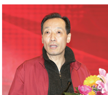
全国政协委员、中华全国新闻工作者协会原党组书记罗惠生