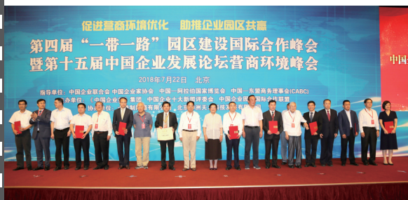
2018年7月22日，北京钓鱼台国宾馆，在第十五届中国企业发展论坛上，参会嘉宾与十佳案例获评单位代表合影。