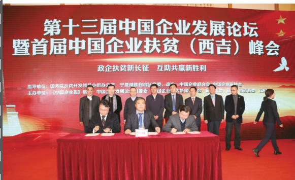
2017年1月15日，北京人民大会堂，第十三届中国企业发展论坛暨首届中国企业扶贫（西吉）峰会举办。