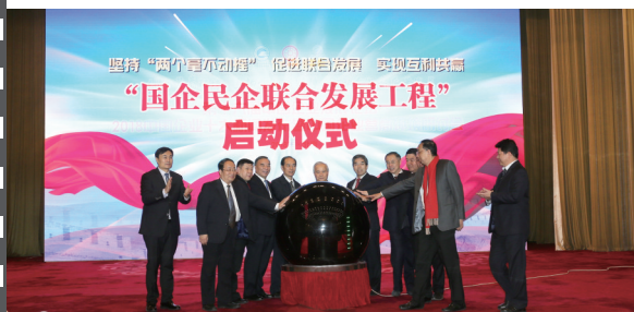
2018年12月28日，北京人民大会堂，在第十六届中国企业发展论坛上，举办了国企民企联合发展工程启动仪式。