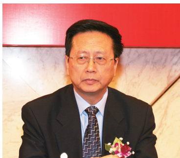
十一届、十二届全国人大常委会副委员长陈昌智