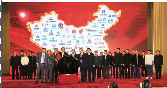
2018年1月20日，北京人民大会堂，在第十五届中国企业发展论坛上，30家企业代表共同启动“十九大精神进企业系列活动”。