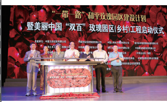
2016年6月26日，北京全国政协礼堂，在第十三届中国企业发展论坛上，《中国企业报》集团联合19家企业及相关组织，共同发起“一带一路”和平玫瑰园区建设计划暨美丽中国“双百”玫瑰园区（乡村）工程。