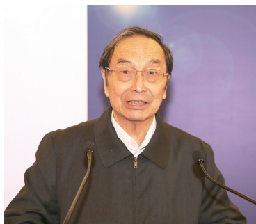
九届、十届全国人大常委会副委员长蒋正华