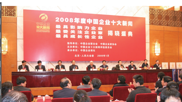
2009年1月，2008年度中国企业十大新闻发布活动在北京人民大会堂隆重举行。