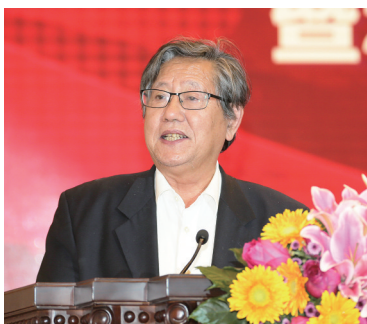
中国企业联合会、中国企业家协会原执行副会长，《经济日报》原总编辑冯并