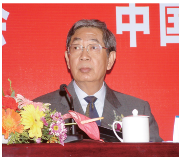
九届、十届全国人大常委会副委员长许嘉璐