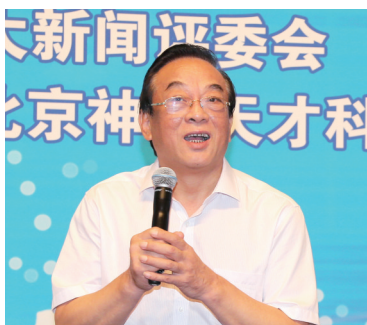
十二届全国政协经济委员会专职副主任，甘肃省委常委、副省长石军

由中国企业联合会、中国企业家协会指导，《中国企业报》集团、中国企业十大新闻评选委员会、中国企业发展论坛组织委员会主办的中国企业发展论坛，已经连续成功举办了十六届，在我国企业、政府、学术界形成了广泛影响。长期以来，论坛活动得到了国家领导人以及国务院相关部门领导的关注和支持，王光英、许嘉璐、蒋正华、顾秀莲、周铁农、陈昌智、万国权、陈锦华、王忠禹、郝建秀、白立忱等国家领导人都曾出席发布暨论坛活动。中国500强企业和一大批卓有影响的企业家，都曾参与活动。