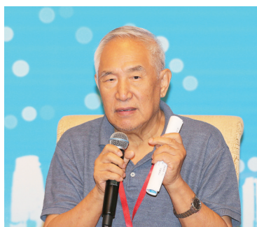
中国工程院院士、著名化学工程专家金涌