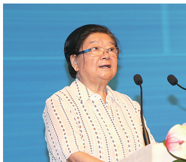
十届全国人大常委会副委员长顾秀莲