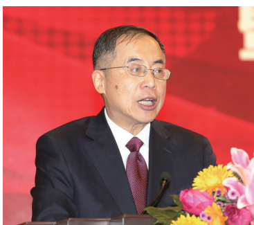
中国企业联合会、中国企业家协会常务副会长兼理事长朱宏任