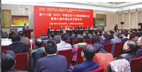
2013年1月，第九届中国企业发展论坛在北京人民大会堂举办。