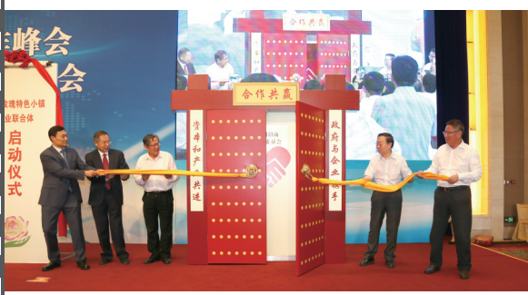
2017年6月25日，北京钓鱼台国宾馆，在第十四届中国企业发展论坛上，由《中国企业报》集团等联合发起的“全国招商联合委员会”宣告成立并举行了揭牌启动仪式。