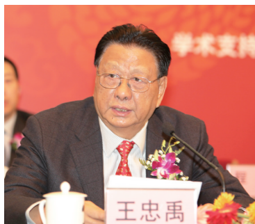
十届全国政协副主席王忠禹