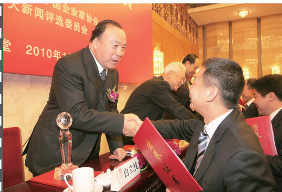
2010年1月，2009年度中国企业十大新闻发布活动在北京人民大会堂举办，第九届、第十届、第十一届全国政协副主席王白立为获奖单位颁奖。