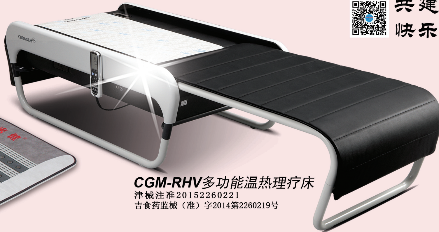
CGM-RHV多功能温热理疗床 津械注准20152260221 吉食药监械(准)字2014第2260219号