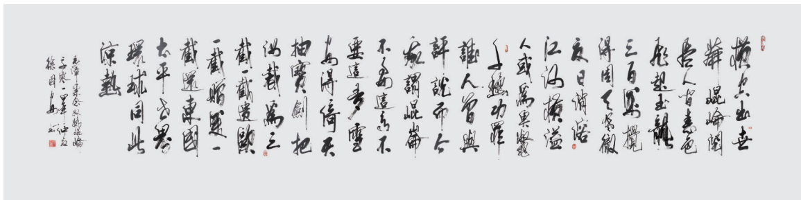
毛泽东诗词《念奴娇·昆仑》