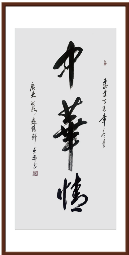
《中华情》138cm × 68cm