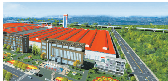
陕西隆翔停车设备示范园