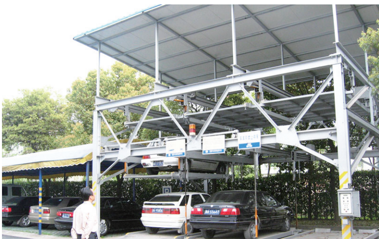
升降横移类立体车库工作原理