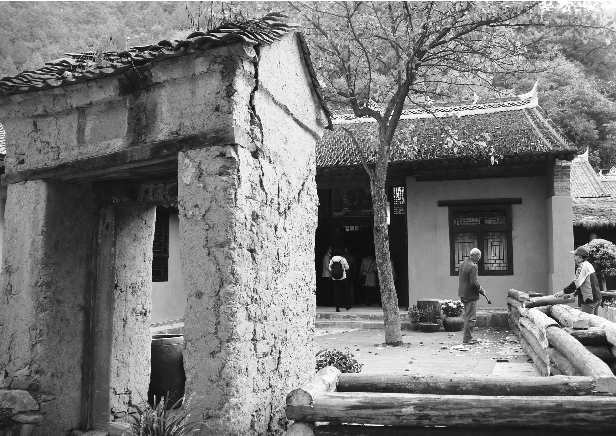
古村落改造被资本看好

张朝伟表示,城镇化离不开企业的参与和支持,要充分调动社会资金和企业力量,包括借助PPP模式开展市政、基础设施和公共服务等领域的投资建设,在这个过程中,尤其需要金融机构的支持配合,为实体经济和城镇化服务也是我国金融改革的主要目的。