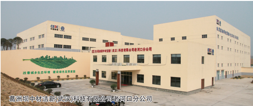
葛洲坝中材洁新(武汉)科技有限公司老河口分公司