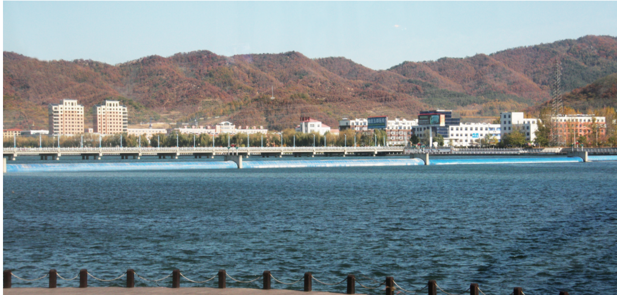
哨子河畔,蓝天、碧水和绿树构成绿色岫岩美丽画卷。

多年以来,岫岩不但实施了国家生态造林工程、国家“三北”防护林体系建设、国家退耕还林工程,还跟进辽宁省以及鞍山市的防护林建设、国家