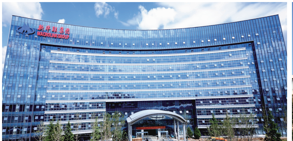
中国企业500强新华联集团总部