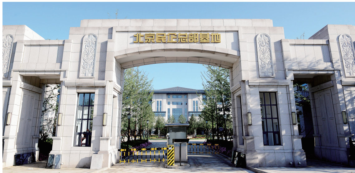
北京民企总部基地