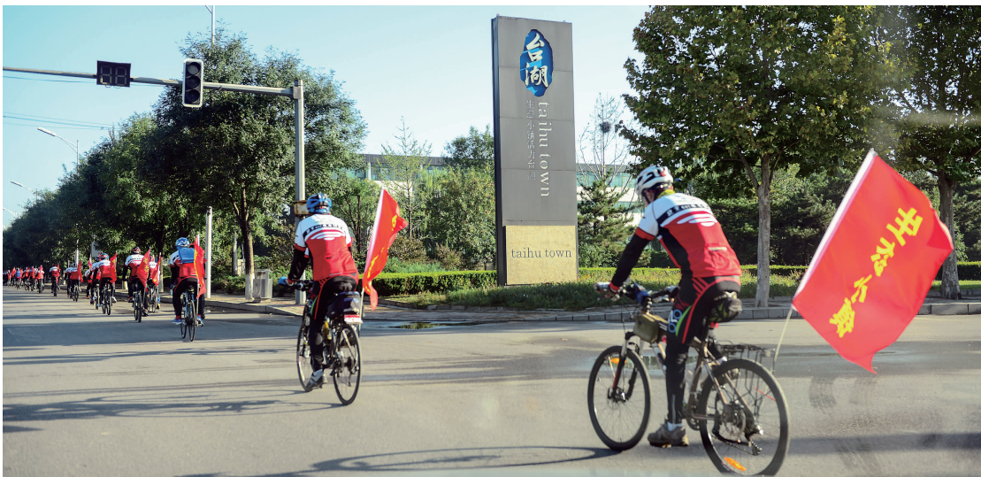
经济发展与人文气息相得益彰