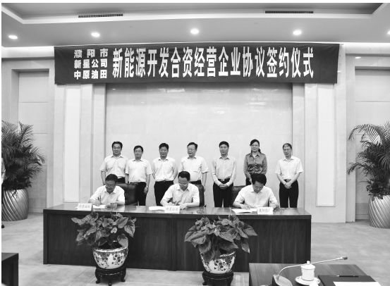
濮阳市与中石化新星石油公司、中原油田合资组建新能源开发企业