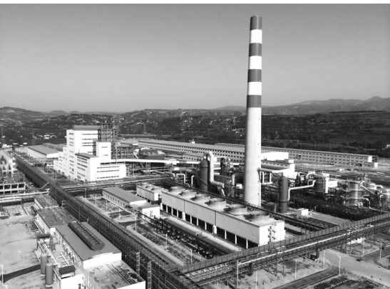
中国黄金集团中原黄金冶炼厂搬迁改造项目