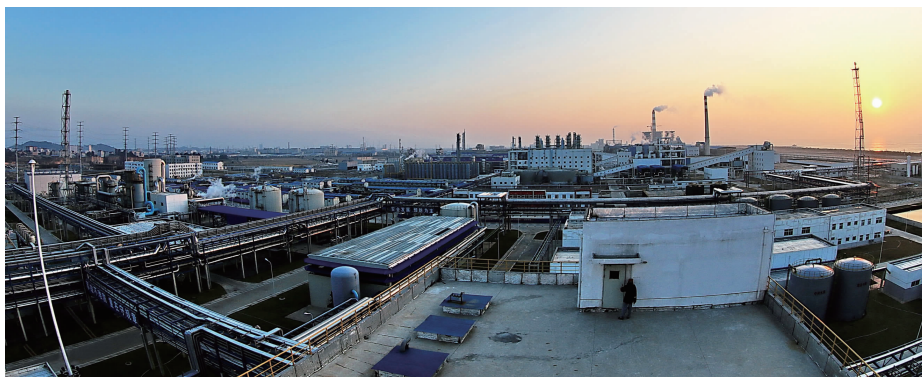
福州市江阴工业集中区化工新材料专区

游通铃信心满满地表示,“江阴工业集中区现在有了更新、更高的规划发展蓝图,正在从原来的单纯工业型向港口与产业及城市良性互动、统筹协调的现代港口城市型发展。力求正潮平当扬帆,担当尽责须奋进。我们将以求真务实、真抓实干的作风和抓铁有痕、踏石留印的力度,推动江阴加快科学发展跨越发展。为加快建设‘机制活、产业优、百姓富、生态美’的新福建作出应有的贡献。”