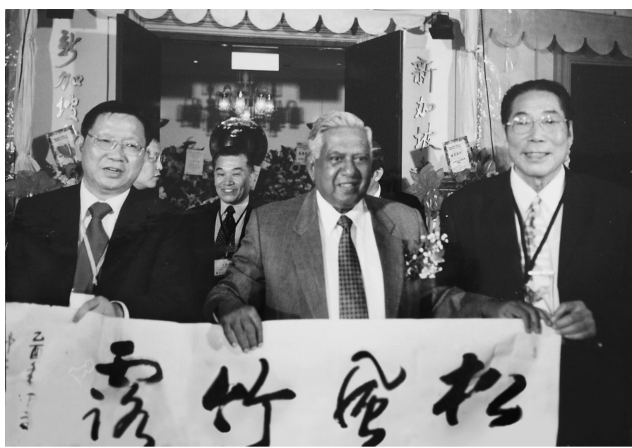
邱零与原新加坡总统纳丹在一起