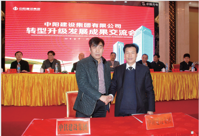
中阳建设集团与中铁建设集团签署模板使用协议