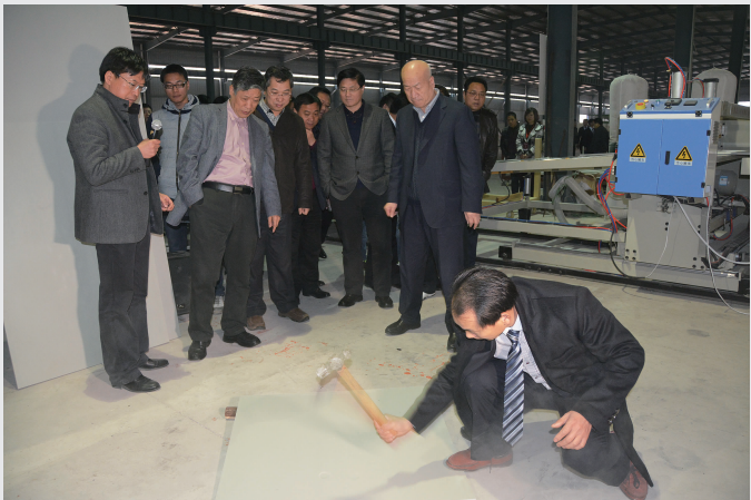
全国学者、专家和有关领导见证重锤之下新型复合塑料建筑模板的牢固耐用性