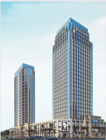
中阳建设集团总部大厦

中阳建设集团有限公司是江西省一家以建筑安装为主、产业多元化的大型企业集团,始创于1953年,2003年完成国企改制,2010年11月正式更名为中阳建设集团有限公司。公司注册资本3.26亿元,拥有房建、市政、机电等总承包及专业承包八项一级资质,业务涉及建筑施工、房地产开发、新型建材研发生产、金融投资等领域,2014年位列江西省百强民营企业第22位。