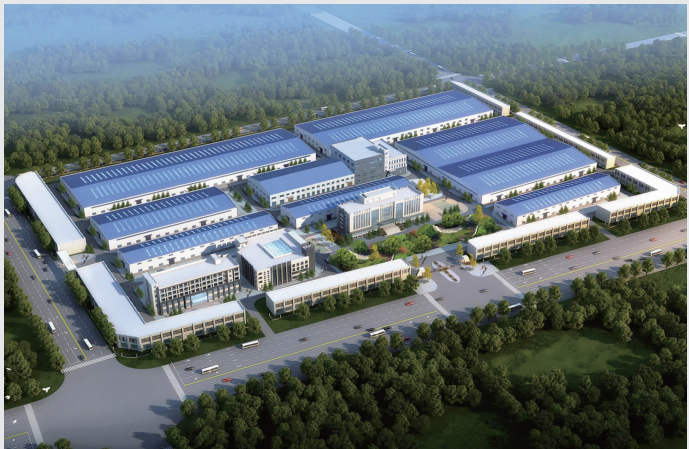
中阳德欣科技有限公司生产厂房