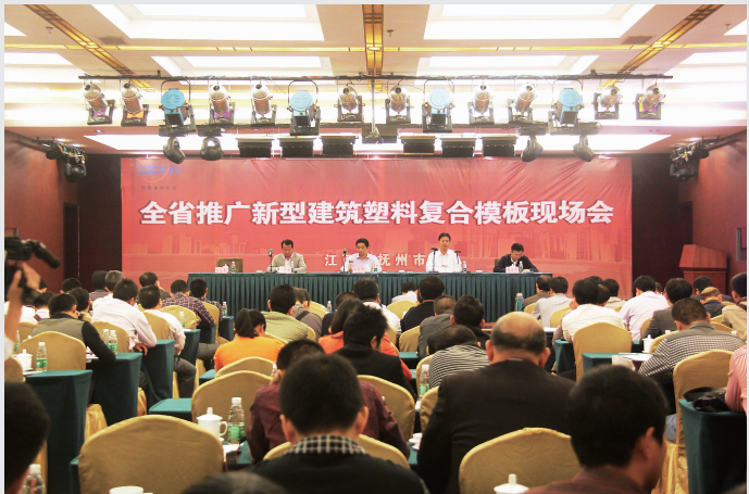
江西省推广新型建筑塑料复合模板现场会

公司大力实施科技兴企战略,拥有省级企业技术中心,主编国家行业标准《建筑塑料复合模板工程技术规程》(JGJ/T 352-2014),获国家级工法3项,国家发明专利3项,实用新型专利12项。全资子公司——中阳德欣科技有限公司研发生产的新型绿色建材产品用于绿色建筑施工、建筑装饰、及环保家具制造等。其中新型建筑塑料复合模板,质量指标国内领先,是全国建设行业科技成果推广项目,全面建成后将成为全国规模最大的塑料模板生产基地,为推进建筑业“以塑代木”、“以塑代钢”,实现行业节能环保发展做出重要贡献。