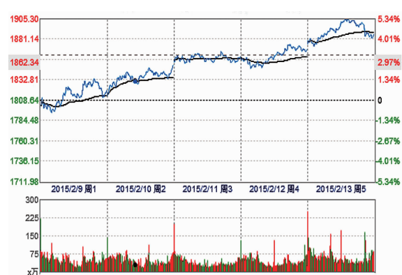
中证中央企业综合指数(2015年2月9日—2月13日)