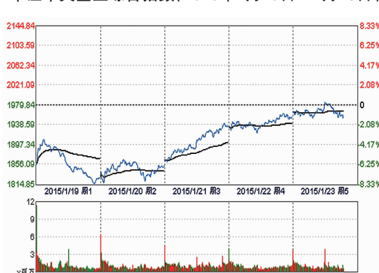
中证中央企业综合指数(2015年1月19日—1月23日)

如果说去年是探路之年的话,2015年国资国企改革将全面展开。这也意味着将出现更多的新情况和新问题。新年伊始,习近平总书记在中央纪委全会专门向国企喊话,实乃心系国企、心忧国企,这也预示着中央将进一步加强对国有企业的制度建设和国企监管。