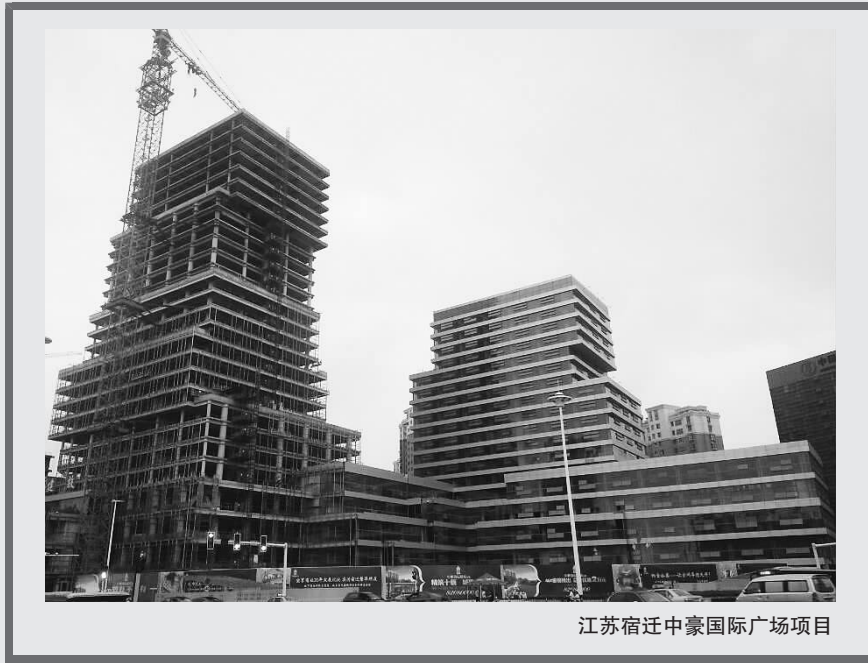
江苏宿迁中豪国际广场项目

对华远地产董事长任志强的“离场”，有媒体将2014年定位成“元老级开发商”的告别元年，也就是说房产开发商的“改朝换代”正在来到，这不免让人想到，随着元老级开发商的退场，房地产市场也许要经历着大转型，钢混结构的建筑逐步减少，而钢结构建筑将大行其道，与之相关的钢结构产业或将迎来真正的“美”与“好”的黄金时代。