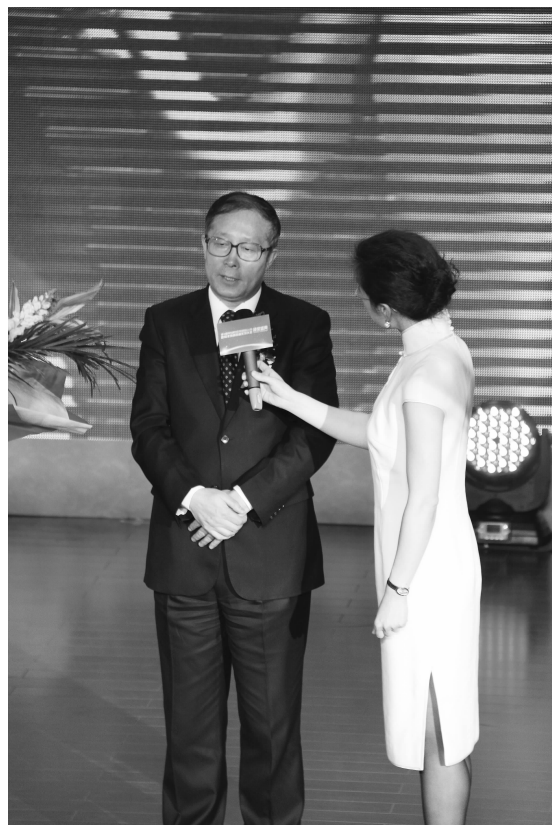
湖北省委书记李鸿忠接受 CCTV 主持人董倩采访,即席诠释“企业家老大”理念

其实,李鸿忠不仅在理论上对他提出的“产业第一,企业家老大”理念进行深刻的诠释,更重要的是用实际行动对他提出的“产业第一,企业家老大”理念进行践行承诺:对于湖北省企联组织举行的“湖北省优秀企业(金鹤奖)、湖北省优秀企业家(金牛奖)评选表彰”、“湖北省百强企业排序及研究”、“湖北经济年度十大风云人物评选表彰”等活动,他都和省领导每场必到为获奖(入选)者颁奖(授牌),并发表重要讲话;他一再叮嘱省委省政府相关部门,“宁愿政府麻烦,不让企业费事”,强