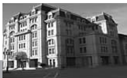
天津繁花商务会所