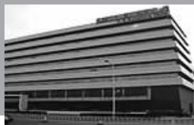
天津诚实阳光酒店