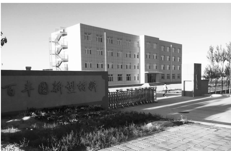
赤峰百丰圆新型材料科技有限公司厂区