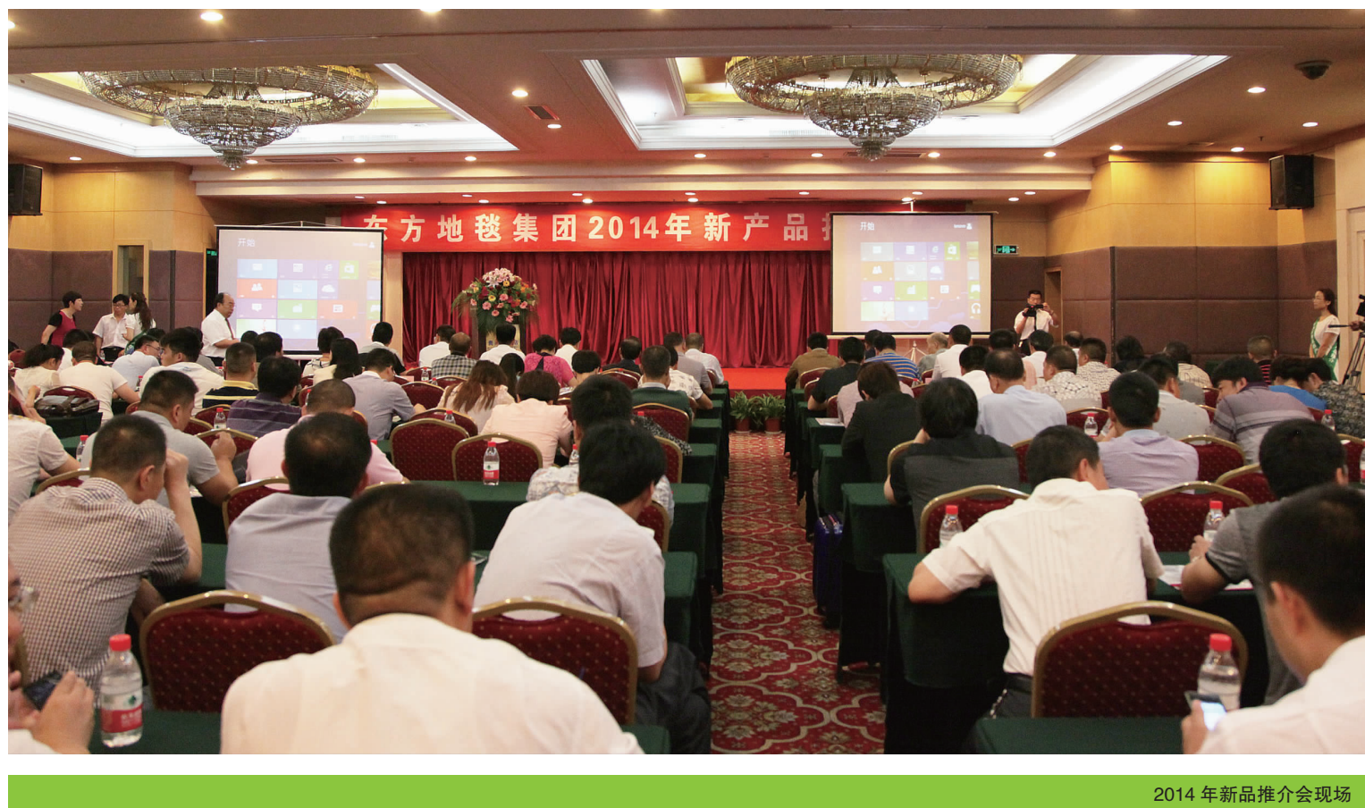
2014年新品推介会现场

而在占先球看来,东方地毯集团近年来不断推出许多市场上难得一见的新产品,充分体现出其强大的产品研发能力和快速反应能力,这大大增强了客户与东方地毯集团