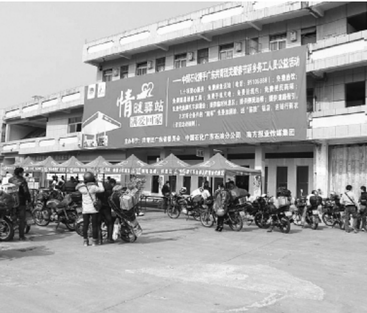
“青春情暖驿站”搭建了休息帐篷给返乡人员中途歇息,摩托车长途骑行非常劳累,骑行1—2个小时就需要下车休息一下,驿站正好作为歇脚点,在早上返乡高峰期,大批返乡人员聚集在休息点。