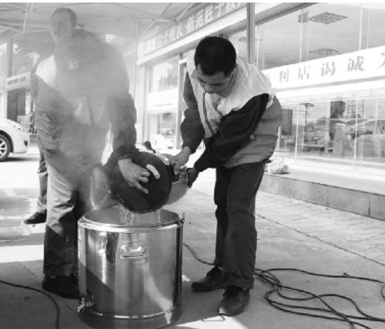
驿站为返乡人员免费提供热开水,在高峰期,每小时就要喝掉7、8桶开水,志愿者们忙着烧水、倒水,提供给返乡人员饮用。