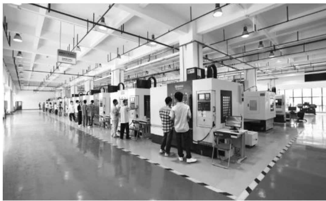
校企合作 校外实训基地