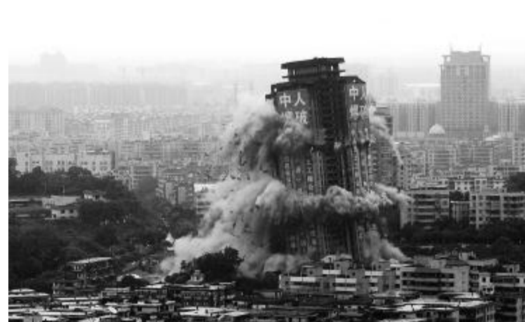
中山市山顶花园(亚洲第一爆)获高大建构筑物高效、安全、环保拆除爆破技术特等奖

据介绍,广东省广晟投资集团有限公司成立于 2008 年 9 月,注册资本 3 亿元,是一家由军队企业广东中人企业(集团)有限公司转制移交,通过改革改制重组与产业转型升级而来的大型国有企业,是广东省广晟资产经营有限公司属下的全资一级企业集团。主要从事高速公路等基础设施投资建设运营、房地产投资开发与物业管理、工程施工及设计和能源贸易,业务遍布全国各地。拥有雄厚的市场拓展资质和资源,一批优秀的管理和专业技术人才,较强的设备实力和领先的工程技术。多年来成功运作了一批大型项目,有着丰富的 BT、BOT 项目经验,一些项目创造了国内和亚洲纪录。与广晟公司以 BOT 方式共同投资了湖北汉蔡、汉鄂、大广南等 3 条高速公路项目,总里程约 200 公里,总投资 130 多亿元。2009 年 8 月 13 日曾成功突破了中山石岐山顶花园(高 104.1 米,34 层),刷新其自身保持多年的全国建筑爆破拆除高度纪录,赢得了“亚洲第一爆”美誉。“广晟建设”品牌已成行业优秀品牌。公司将发扬传统,全力以赴,精心组织,科学施工,打造优质工程、文明工程、样板工程,为中山交通发展贡献一份力量。