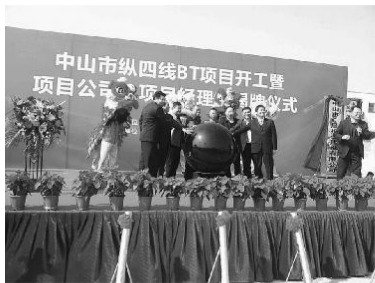
中山市纵四线 BT 项目开工揭牌仪式