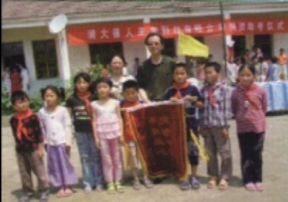
清大百奥奇积极参与社会公益事业