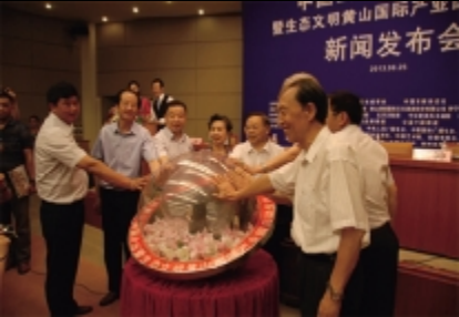
首届中国画黄山国际论坛启动仪式 在国务院新闻办举行