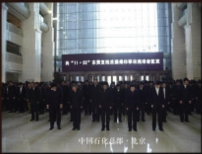
中国石化总部·北京

2013年11月28日上午10点33分,中国石化总部及所属100多家企业在各地同时举行哀悼仪式,百万员工沉痛悼念“11.22”东黄复线漏油爆炸事故中遇难者,并将11月22日定为中国石化安全生产警示日。